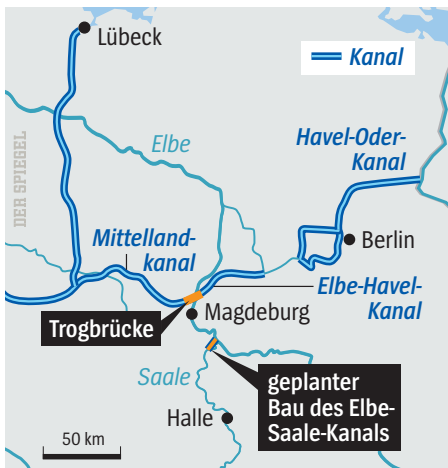
Wasserstraßenkreuz Magdeburg: Meist warten die Touristen vergebens

Aber die Ausgaben für den Betrieb der Wasserstraßen stiegen weiter. Auf der Elbe haben sie sich in den vergangenen fünf Jahren mehr als verdoppelt, auf zuletzt 36 Millionen Euro pro Jahr. Die Elbe